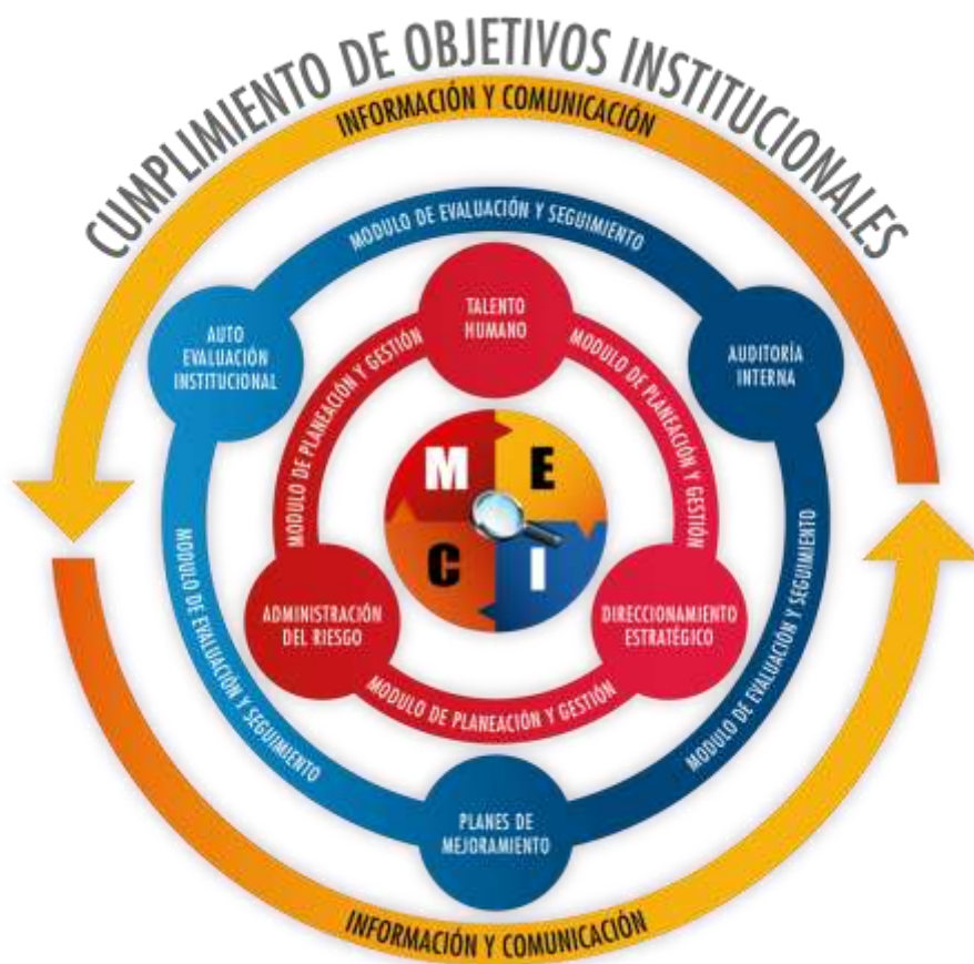
Ilustración 1. Estructura del Modelo Estándar de Control Interno

El gráfico que a continuación se muestra permite observar la estructura del MECI: